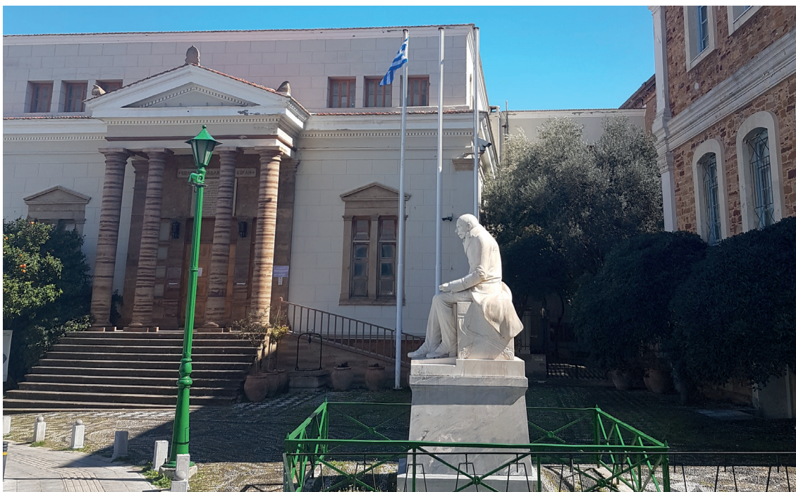
Η βιβλιοθήκη «Κοραΐς» της Χίου. Σε πρώτο πλάνο το άγαλμα του Χίου σοφού.

Ο κράτιστος φιλόλογος, Διδάσκαλος του Γένους -και με καταγωγή από τη Χίο- Αδαμάντιος Κοραΐς (1748-1833) θα μπορούσε να θεωρηθεί και ευεργέτης της Ελλάδας και μόνο για την πνευματική του προσφορά, για το «φωτισμό» του υπόδουλου έθνους που είχε ως όραμα και που προσπάθησε να πραγματώσει στη διάρκεια της ζωής του 9 . Και να σκεφθεί κανείς ότι κι εκείνος βρέθηκε 23χρονος στην ελληνική παροικία του Άμστερνταμ, για να γίνει έμπορος... Ένα μέρος των συγγραφών του Κοραΐ αποτελείούσαν φυλλάδια, κατά κάποιον τρόπο προπαγανδιστικά, σε σχέση, εκτός από την αφύπνιση της εθνικής συνείδησης ειδικά των αποδήμων Ελλήνων, με τη διάθεση υλικών μέσων για εθνικούς σκοπούς, με κυριότερο, ασφαλώς, τη μόρφωση των υποδούλων συμπατριωτών. Τον ίδιο ρόλο έπαιζαν συχνά και οι επιστολές του προς γνωστούς Έλληνες της εποχής του, πλούσιους των παροικιών ή λογίους, καθώς η αλληλογραφία του ήταν ογκωδέστατη. Αξίζει να παρατεθεί ένα εύγλωττο απόσπασμα από επιστολή του Κοραΐ στον Ψαριανό ευεργέτη Ιωάννη Βαρβάκη: «Πλοῦτον χαρίζει εἰς πολλοὺς ὁ Θεός, ἀλλ' εἰς ὀλίγους δίδει καὶ τὴν γνῶσιν πῶς νὰ τὸν μεταχειρίζωνται. Δόξαζε λοιπὸν ἀπὸ ψυχῆς τὸν πλουτοδότην Θεόν, ὅτι σ' ἐδιάλεξε καὶ ὄργανον τῆς Πρόνοιας του, διὰ νὰ θεραπεύσης τὰς πληγὰς τῆς Ἑλλάδος, καὶ μὴν ἀποκάμης εἰς τὰ ὅποια σὲ κινεῖ καλὰ ἢ κραταιὰ του χεῖρ, μὲ τὴν ἐλπίδα ὅτι θέλεις ἀκούσει ἀπ' Αὐτόν, τὸν χρεωστούμενον εἰς τὴν φιλογενεῖάν σου, γλυκὸν ἔπαινον». Γενικά, ο Κοραΐς έβλεπε