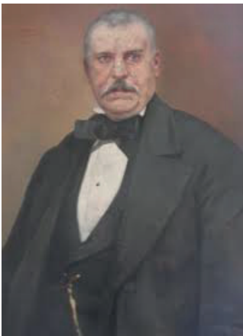
Ζωρζής Δρομοκαϊτης (προσωπογραφία του Νικηφόρου Λύτρα)