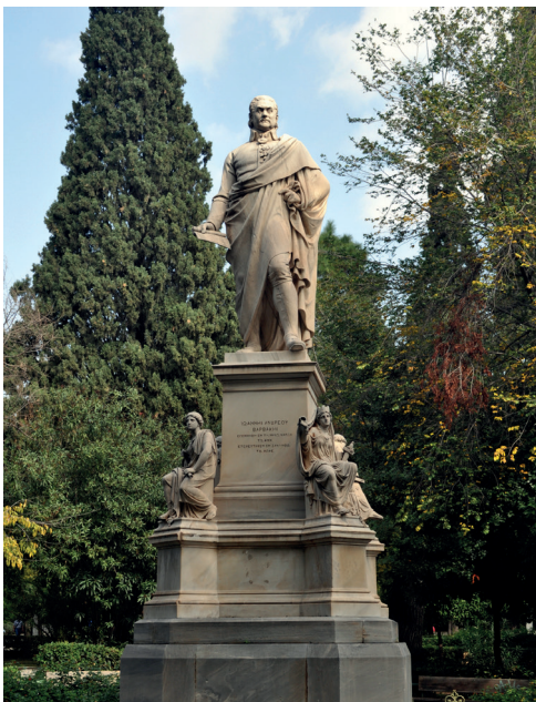
Ο ανδριάντας του Ι. Βαρβάκη στο Ζάππειο

Αν και μάλλον αυτοδίδακτος, και γι' αυτό με ελάχιστη μόρφωση, ο Βαρβάκης είχε αντιληφθεί, λόγω της οξύνοιας και κάποιων γνωριμιών του, τη σημασία της παιδείας και έτσι άφησε με τη διαθήκη του το μεγαλύτερο μέρος της περιουσίας του στο ελληνικό κράτος για την ανέγερση εκπαιδευτικών ιδρυμάτων. Το 1843, με βουλευτικό διάταγμα, η επιθυμία του ικανοποιήθηκε και άρχισε στο κέντρο της Αθήνας η ανέγερση της Βαρβακείου Σχολής που τελείωσε το 1859. Η Σχολή μετεγκαταστάθηκε στο Παλαιό Ψυχικό τη δεκαετία του 1950 -το αρχικό κτίριο υπάρχει μέχρι σήμερα ως Βαρβάκειος Αγορά. Αυτός ήταν ο Ψαριανός εθνικός ευεργέτης Ιωάννης Βαρβάκης, ο επονομαζόμενος «ευεργέτης δύο πατρίδων» 14 .