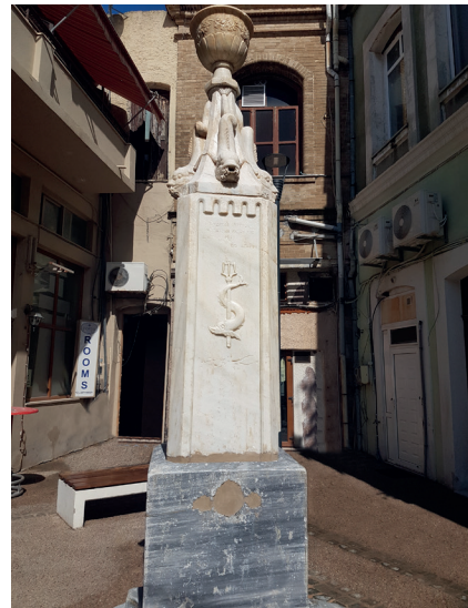
Η «περικαλλής» κρήνη Συγγρού στην οδό Ροΐδου