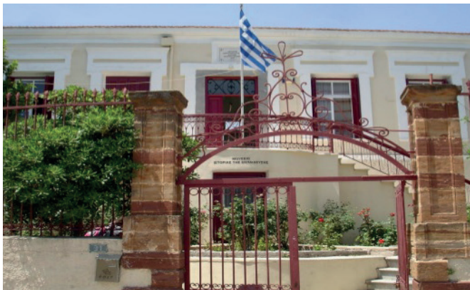
Το Βούρειο Δημοτικό Σχολείο Λιβαδίων