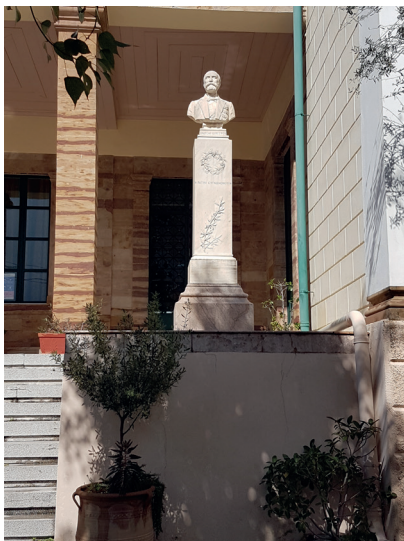
Η πρωτομή του Α. Συγγρού στα προπύλαια του Γυμνασίου Χίου

Ξεχωριστή είναι η περίπτωση του Ανδρέα Συγγρού (1830-1899), του ίσως γνωστότερου, αλλά και πιο πολυσυζητημένου εθνικού ευεργέτη. Καταγόταν από το Λιθί, χωριό της νοτιοδυτικής Χίου. Ο πατέρας του ήταν ιατρός, με σημαντική επιρροή στα πράγματα της Κωνσταντινούπολης, ενώ και η μητέρα του ήταν Χιώτισσα, το γένος Νομικού. Ο Συγγρός ξεκίνησε ως έμπορος, αλλά τελικά ασχολήθηκε κυρίως με τραπεζικές δραστηριότητες και αναδείχθηκε στον πλουσιότερο και ισχυρότερο Έλληνα κατά το δεύτερο μισό του 19ου αιώνα. Σε τουλάχιστον δύο περιστατικά της οικονομικής ζωής του ελληνικού κράτους το ίδιο χρονικό διάστημα ο ρόλος του ήταν αμφιλεγόμενος. ωστόσο, φρόντισε να προβάλει τη δική του εκδοχή στα πολύ ενδιαφέροντα απομνημονεύματά του. Και βέβαια, με τη διαθήκη του, εκτός από τις γνωστότερες ευεργεσίες του, κυρίως στην Αθήνα