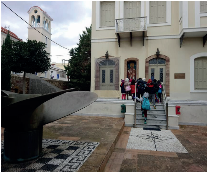
Το Ναυτικό Μουσείο Χίου